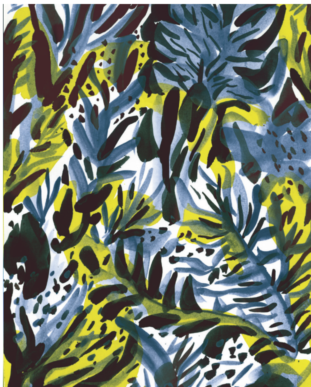
entre le jardin et les poumons.

Cet automne, elle effectuera une nouvelle résidence de création avec en ligne de mire une concrétisation qui pourrait prendre la forme d'une exposition et/ou d'une édition et/ou d'une performance... Tout est encore possible!